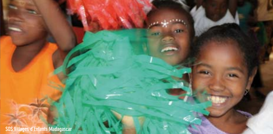
SOS Villages d'Enfants Madagascar