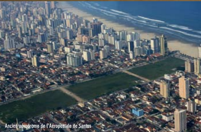
Ancien aéroport de l'Aéropostale de Santos