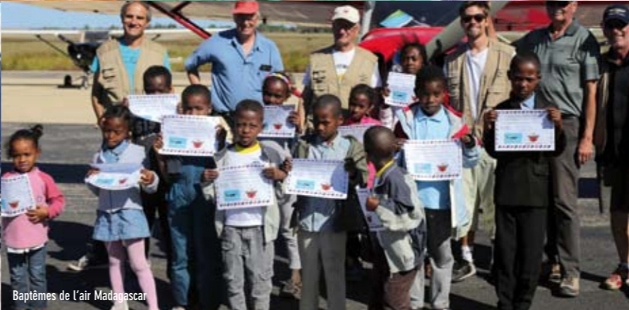
Baptêmes de l'air Madagascar