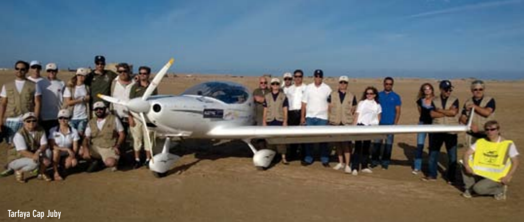
Tarfaya Cap Juby